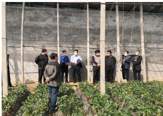
外出学习温室大棚种植技术