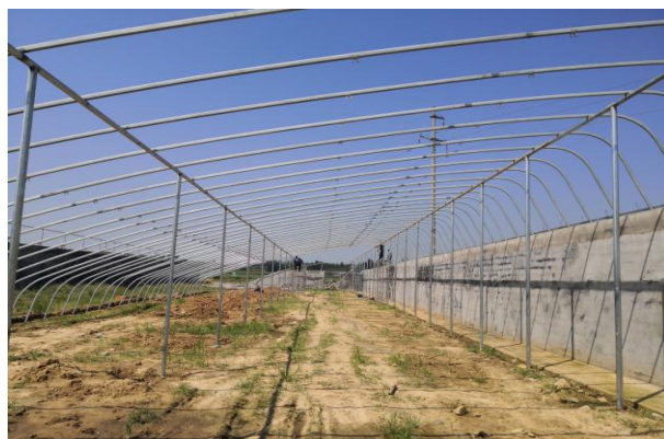
即将完工的温室大棚