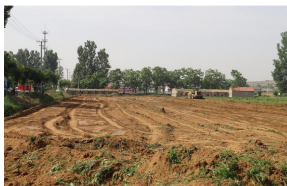
温室大棚项目现场