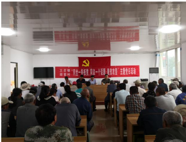
主题党日活动会场

村党支部书记带领全体党员宣誓、签订《脱贫攻坚承诺书》，确保每名贫困群众都有1名干部包保、1名帮扶责任人帮扶、1名党员结对。活动中，包保干部充分发挥了引领作用，农村党员当起了先锋，帮扶责任人明晰了现阶段的帮扶职责，贫困群众知党情、感党恩，群众满意度得到进一步提升。主题党日活动充分发挥了基层党组织优势，强化了基层党组织脱贫攻坚的政治责任，激发了群众的内在动力，凝聚了党心民心。