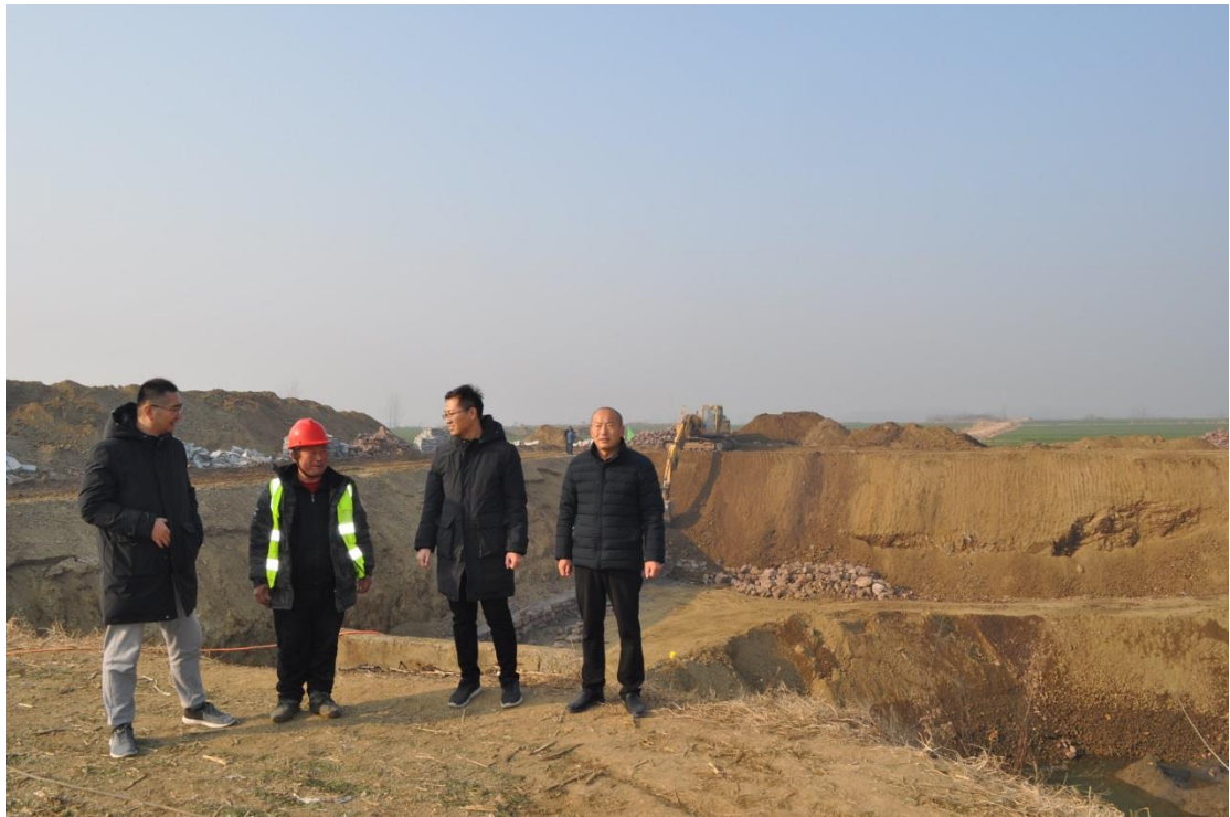
图二：大口井施工现场

泉村、房庄村，投资估算 750 万元。将从邻近的白马河拦河坝建设泵站提水，维修护砌大口井 9 座，埋设 PE 管道 2.8km，排水沟清淤 9.18km，架设 10KV 高压线路 1.1km，安装 100KVA 箱式变压器 1 台，硬化生产路 3.34km，栽植女贞树 2000 株，测土配方施肥 2500 亩。建成后，基本农田达到“土地平整、集中连片、设施完善、农电配套、土壤肥沃、生态良好、抗灾能力强、旱涝保收、高产稳产”的目标。