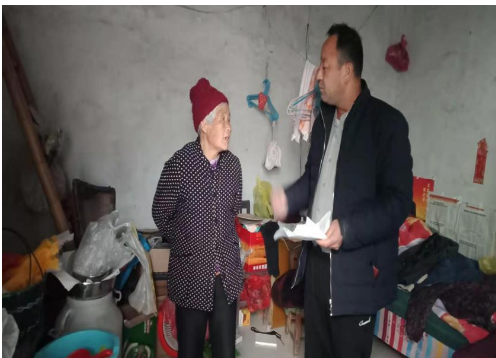
建档立卡贫困户走访