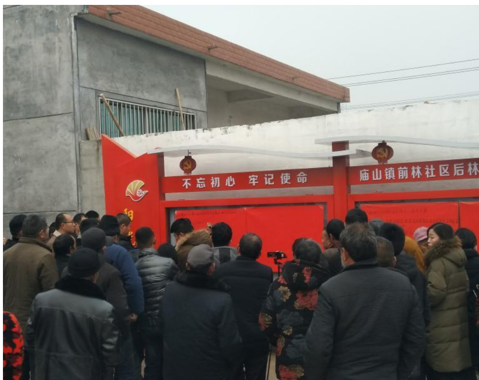
村委换届选举唱计票