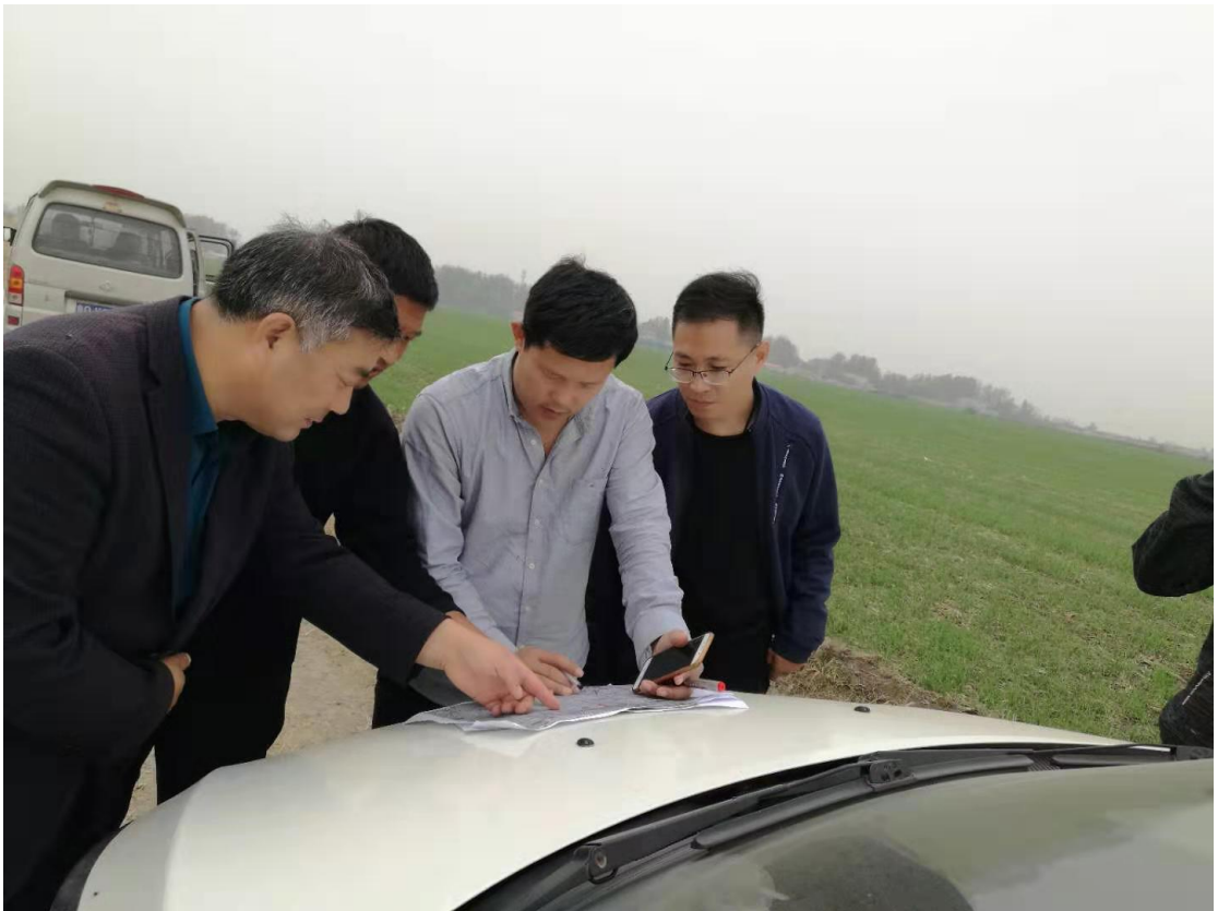
图一：2019年10月，现场编制建设方案

2019年4月，省信访局第一书记驻村后，群众反映承包地一直靠天吃饭，旱季浇不上水，涝了排不出去，大型农业机械进不来，粮食产量低，农业生产水平低，土地效益差。群众利益无小事。去年下半年，第一书记多次到农业农村部门汇报沟通，功夫不负有心人，三个帮包村连片打造5000亩高标准农田项目通过审批立项。